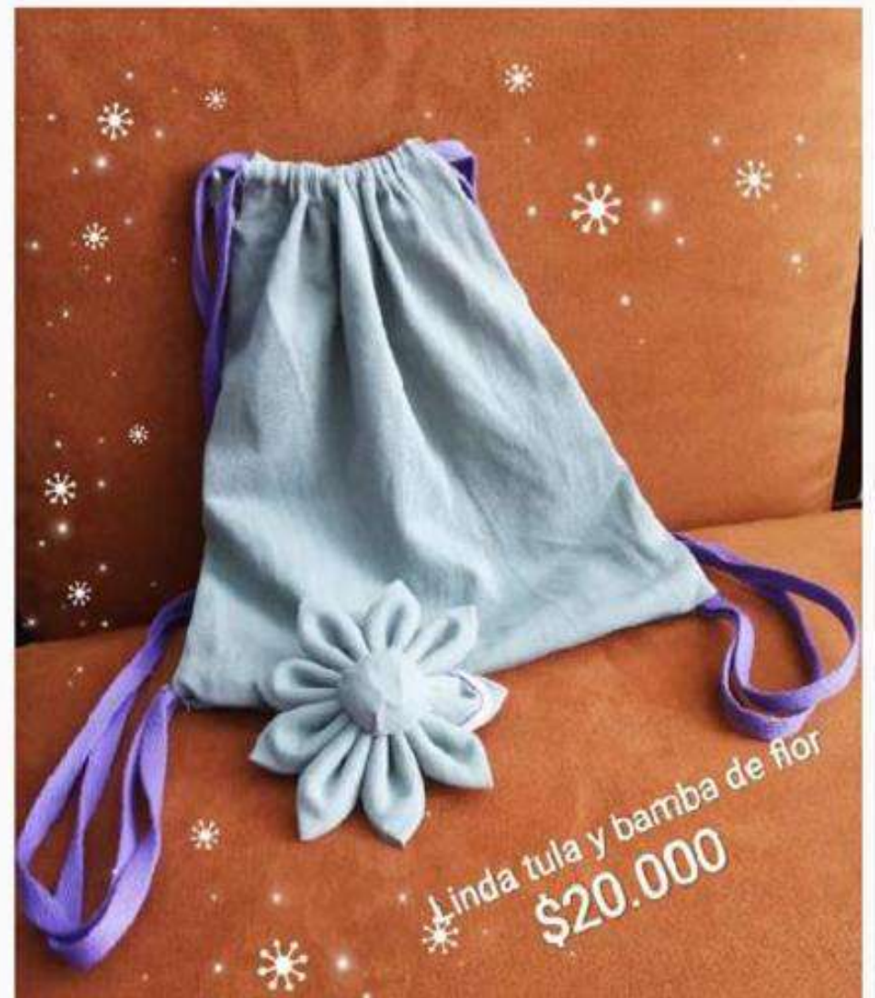
Linda tula y bamba de flor $20.000