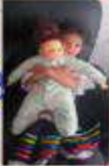
Mi mejor compañera