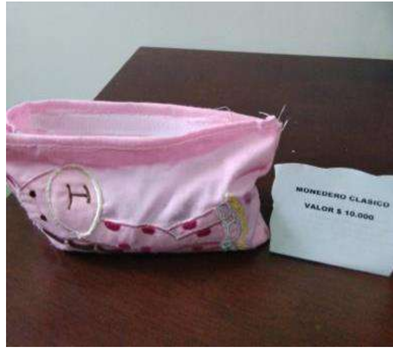
Hermoso monedero clásico Elaborado por Steffany Rodriguez Curso: Tr.B Precio: $10.000